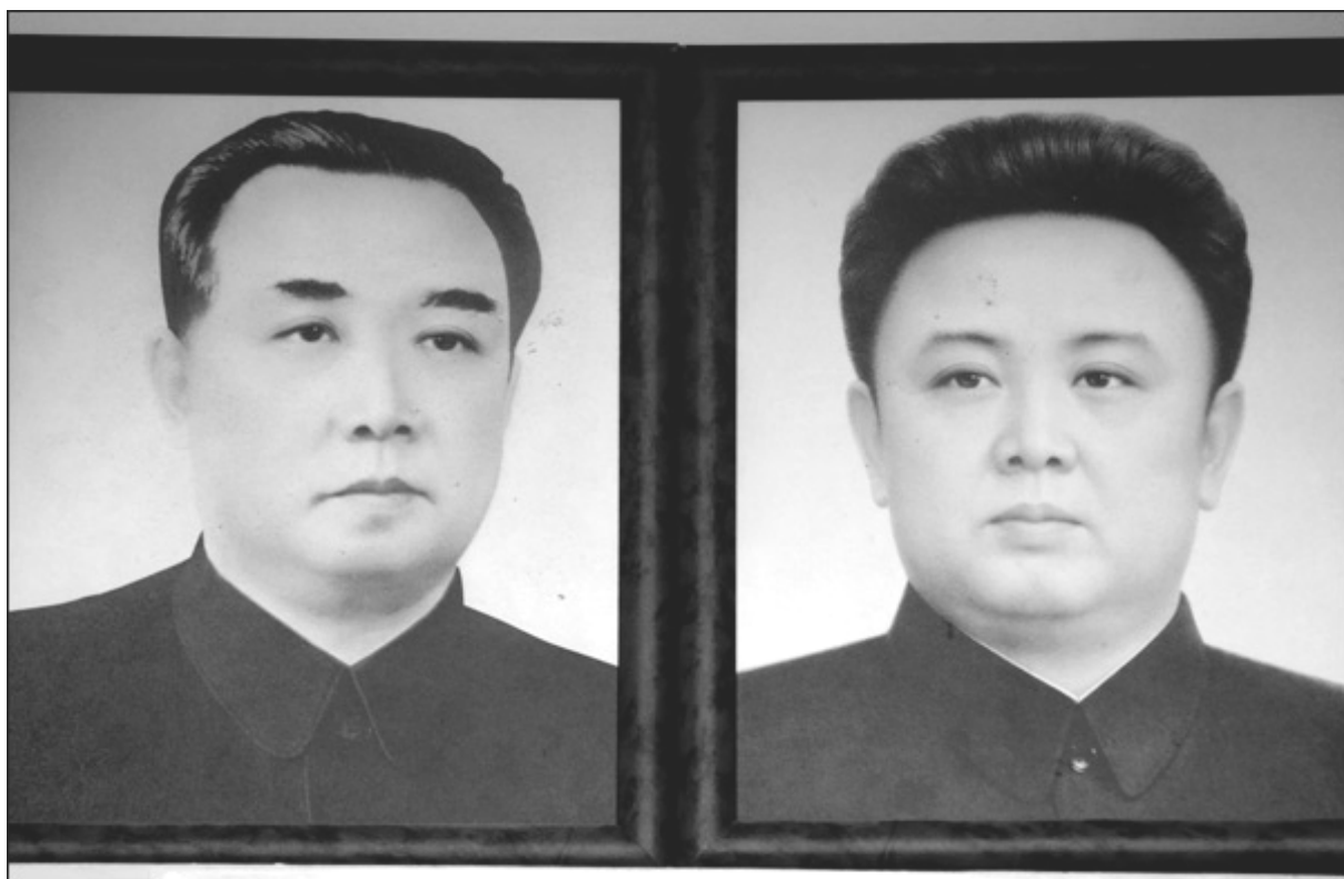
Генеральному секретарю Трудовой партии Кореи Председателю Государственного Комитета Оборона КНДР Верховному Главнокомандующему Корейской Народной Армии Товарищу Ким Чен Иру