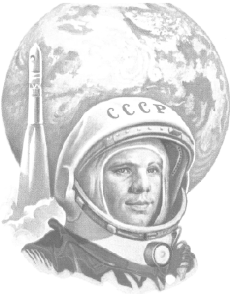
Юрий Алексеевич Гагарин

50-летие запуска первого советского человека в космос Слава советской космонавтике!